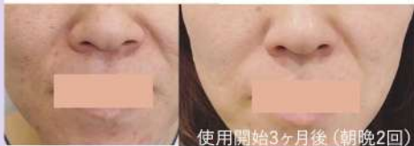
左: before 右: after

シミ、色ムラ、肌荒れをなくし、顔全体が明るくなりました。ほうれい線も改善されました。