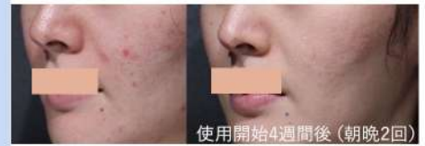
左: before 右: after

弱い風でプラズマイオンをたっぷり肌に当てることで、表皮組織には衝撃を与えずに、滅菌作用によるニキビ改善。