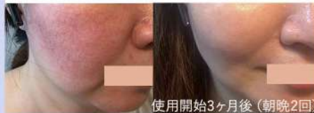
左: before 右: after