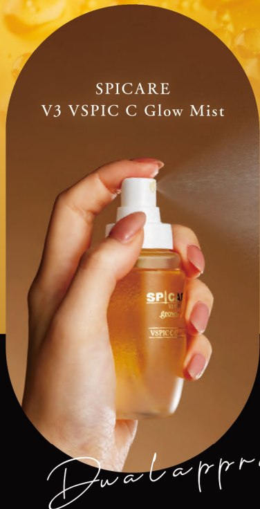
SPICARE V3 VSPIC C Glow Mist